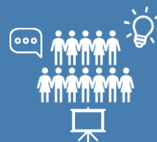
TABLE RONDE DU DÉVELOPPEMENT DURABLE