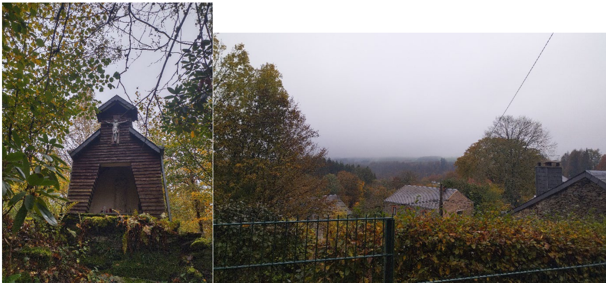
Figure 1: Chapelle Notre Dame de la Scaïre