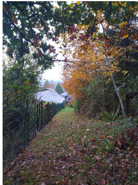
Figure 4: Chemin qui monte vers la chapelle