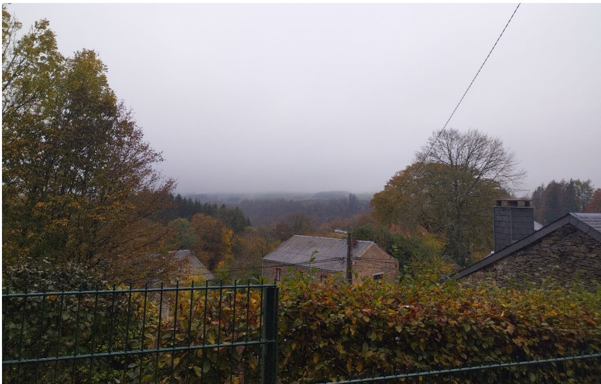
Figure 5: Vue depuis le chemin qui monte à la chapelle