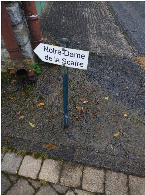
Figure 3: Panneau à l'entrée du chemin