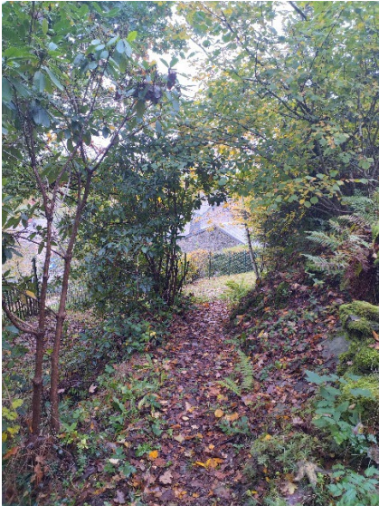
Figure 6,7, 8 et 9: Chapelle notre Dame de la Scaïre et ses abords.