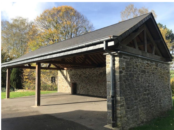
Figure 2 : Abris situé à côté de la maison de village