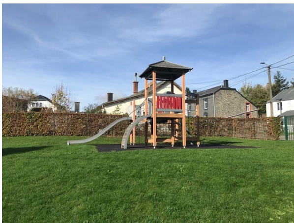
Figure 2 : Un des deux modules présents