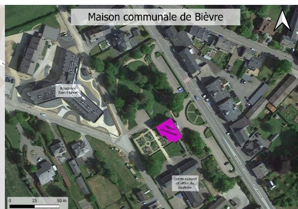
Figure 2 : Localisation sur google maps sat