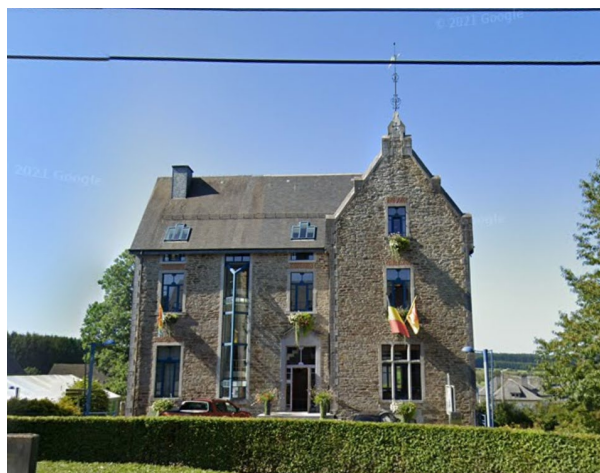
Figure 3 : Maison communale vue avant