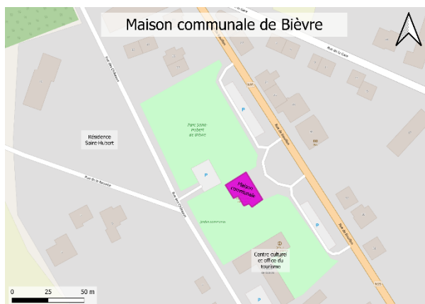
Figure 1 : Localisation sur OpenStreetMap